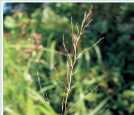
Panicule après avoir eu largué les graines