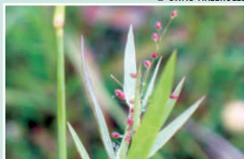
Panicule de la fin d'été, poussant de l'aisselle