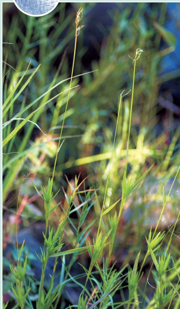
Le panic dédaigné avec des panicules qu'ont largué leurs épillets