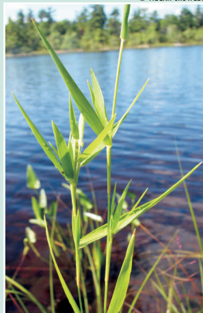
Feuilles qui pointent par en haut